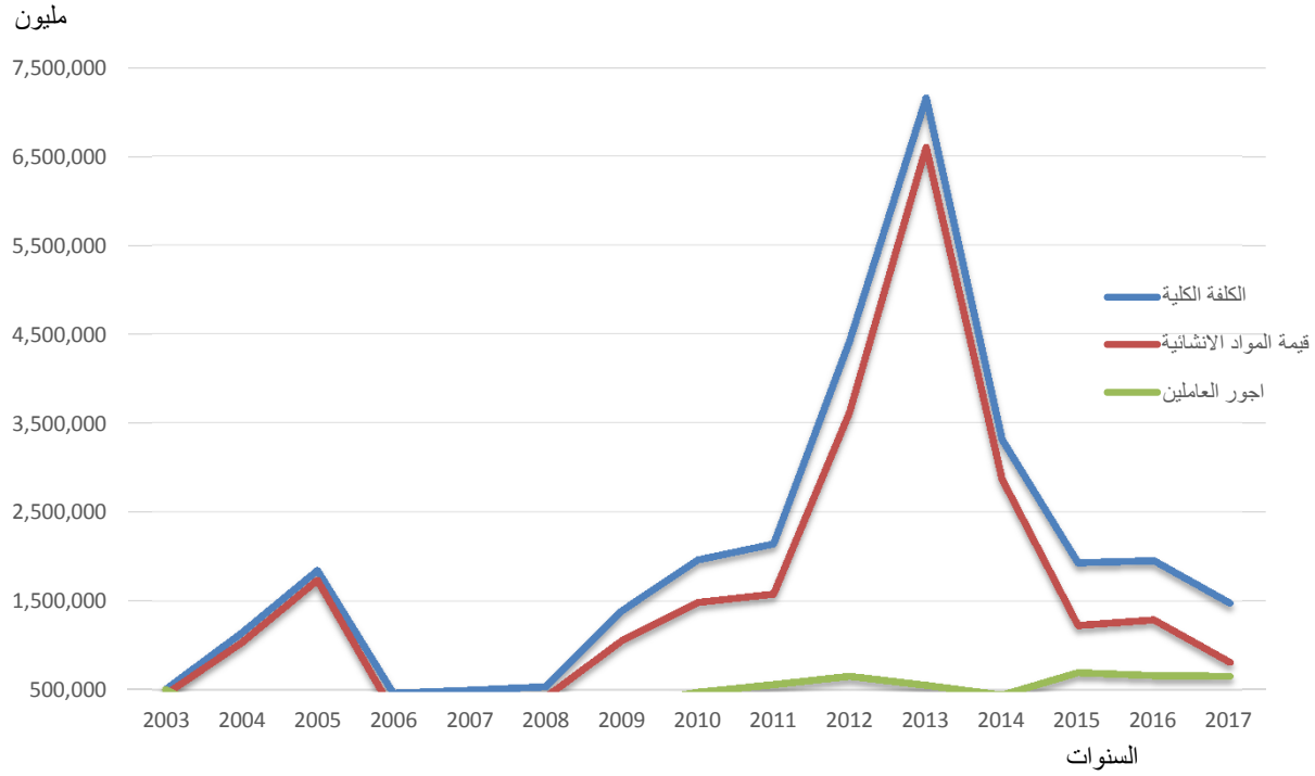
شكل (1) الكلفة الكلية وقيمة المواد الانشائية واجور العاملين لابنية القطاع الخاص للسنوات (2017-2003)